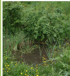
Aktuální stav tůňky