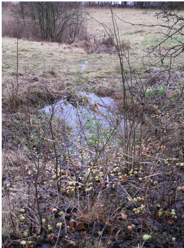
Obr. 3: původní stav