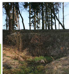
Původní stav tůňky – jaro 2013

Celé místo slavnostně představíme 25.6.2013 ve 13.00 hodin.