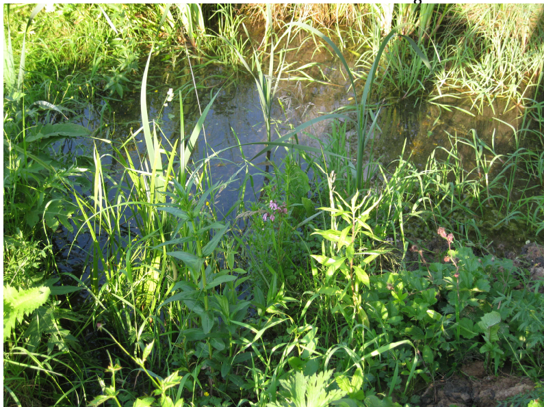
Obr. 5: osázení břehů tůně