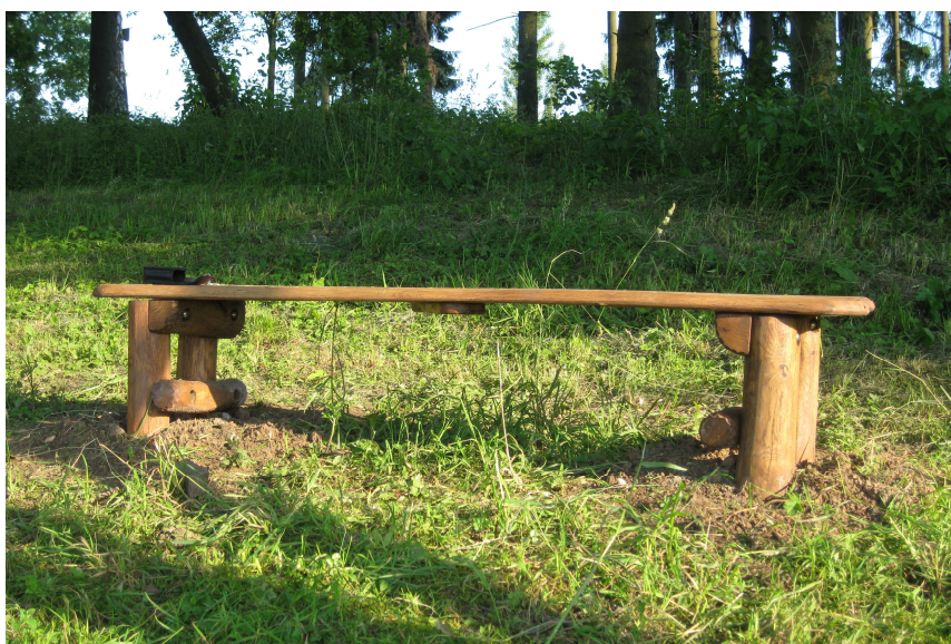
Obr. 6: instalace lavičky