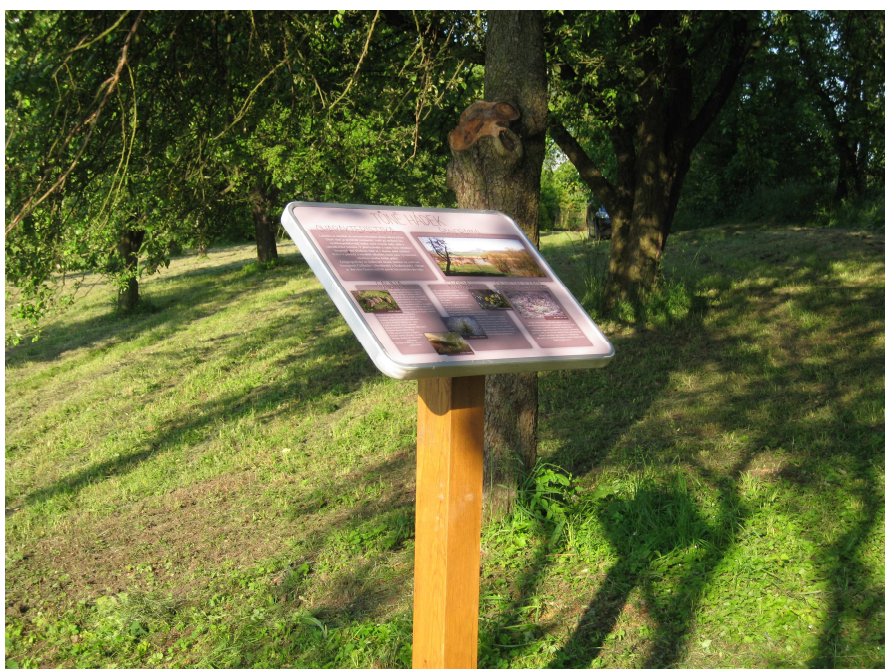
Obr. 7: instalace informační tabule