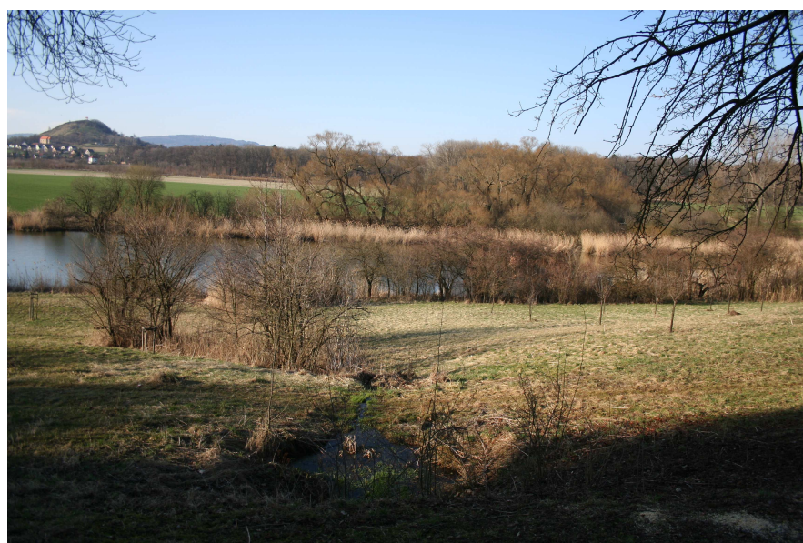
Obr. 1: okolí tůně

Lokalita se nachází na severovýchodním okraji města Jičína. Okolí tůně je poměrně rozmanité: tvoří jej smíšený les, neobhospodařovaná louka, staré ovocné sady, pole a zahrádkářské kolonie. V jihovýchodní a zadní části rybníka v bezprostřední blízkosti tůně se v dnešní době nachází břehové porosty a rozsáhlé rákosiny, které jsou významnou lokalitou mnoha druhů ptáků. Zoogeograficky se sledované území nachází na rozhraní bioregionů Cidlinsko – chrudimský a Hruboskalský. Oblast je obývána faunou nižších poloh hercynského původu.