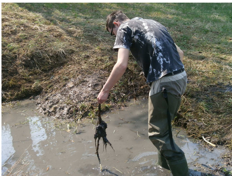
Obr. 4: čištění tůně

3. fáze: Tato fáze trvala také měsíc. Byla rozdělena do dvou částí. V první části jsme odebrali vzorek vody pro hydrobiologický rozbor (zjištění pH a přítomnosti bezobratlých). Dále došlo samotnému vyčištění tůně. Následovalo odplevelení břehů, zrytí břehu tůně a jejich zpevnění a následná výsadba porostu, například orobince nejmenšího ( Typha minima hoppe ), rozrazilu bažinního ( Veronica anagalloides ), rozrazilu rezekvítku ( Veronica chamaedrys ), přesličky zimní ( Equisetum hyemalis ), kosatce žlutého ( Iris pseudacorus ). Rostliny byly věnovány ze soukromé sbírky jednoho z rodičů. Také jsme rozběhli propagační akce, jako například rozmístění pracovních listů do základních škol a umístění článků do tisku a na internet. V druhé části jsme instalovali informační tabuli, lavičku, koš a další doplňky, a to za dobrovolné pomoci rodičů.